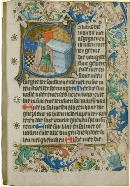
'Sarijs handschrift' vervaardigd in kringen van de Moderne Devotie (Deventer, Zwolle, 14e eeuw). Collectie Historisch Centrum Overijssel. Zie http://maandvande-geschiedenis.innl.nl/page/23017/nl

lijkt niet weg bij het meest innige en intense denken van de mens.